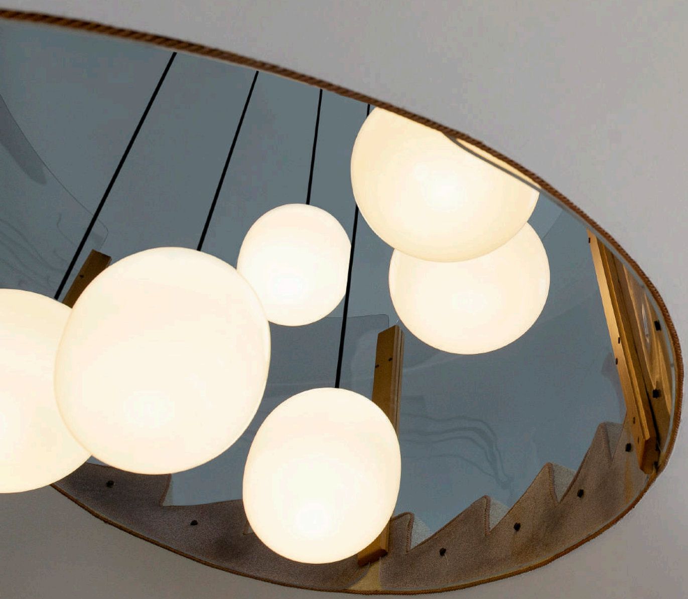
LEGIER CUSTOM CLUSTER