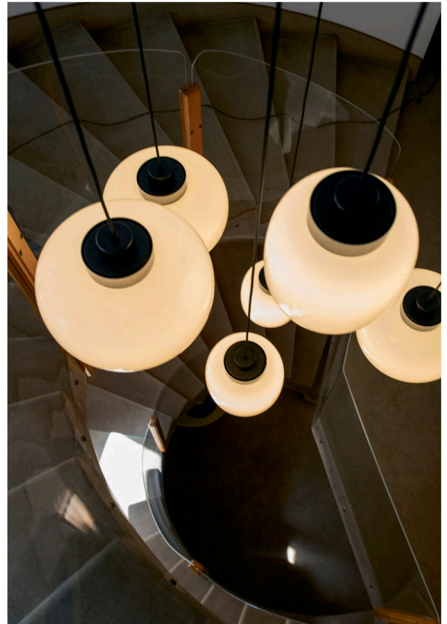
LEGIER CUSTOM CLUSTER